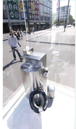
WC – Sicht von innen